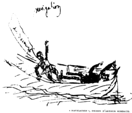
Figura 2: "Navigation", de Arthur Rimbaud, en Album Rimbaud , ed. Henri Matarasso y Pierre Petitfils (Paris: Gallimard, 1967), 17.

Tal vez sea García Madero el auténtico rimbauldiano de la novela, desapareciendo de manera absoluta. Sin embargo el paralelismo se establece entre Rimbaud y Belano, ya que ambos acaban desapareciendo a los ojos del mundo (y en el caso de Belano efectivamente) en África. Allí es donde acaban las ansias de libertad e independencia absolutas de ambas figuras. Solamente la vida, no la poesía, era capaz de realizar el ideal. Y solamente una vida de renuncia es capaz de huir de los mecanismos de poder y sumisión basados en la racionalidad moderna. Esa renuncia se realiza en Rimbaud y en Belano mediante "[u]n besoin de disparaître – un besoin de rompre avec le discours ..." 83 Belano es la reencarnación de Rimbaud el vagabundo y el nómada que desaparece en África. Belano es el "[f]ascinante héroe postmoderno ..., liberado de los estándares modernos de adscripción a una[...] identidad, ..." 84 Solamente una figura capaz de realizar el deseo de Rimbaud y capaz de incorporar a su práctica vital el modelo existencial rimbauldiano puede sustituir a Ulises. Solamente un personaje cuyo deseo es no caer en la maquinaria de la vida rutinaria, aburguesada y productiva puede acabar con la figura paradigmática de la modernidad. El centro de la novela lo forma un espacio vacío,