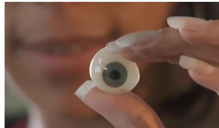
Fig. 10: Flavia enseña un ojo de vidrio a Ana

(véase imagen 9). Es decir, ella “contrafilma” (“films back”), encuadrando a los hombres europeos con el lente de su cámara imaginaria, lo cual articula su respuesta tanto en términos de género como de postcolonialidad, pero al mismo tiempo da claves también para el último tema que es el de hacer cine en Cuba.