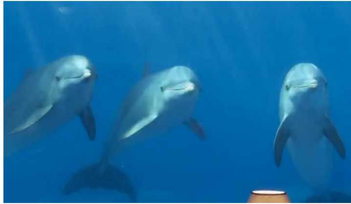
Fig. 7: Los delfines: contramirada, vigilancia y escopofilia

en relación al caso cubano –como la mitología revolucionaria 21 – con el que comparte, de todas formas, algunos rasgos esenciales.