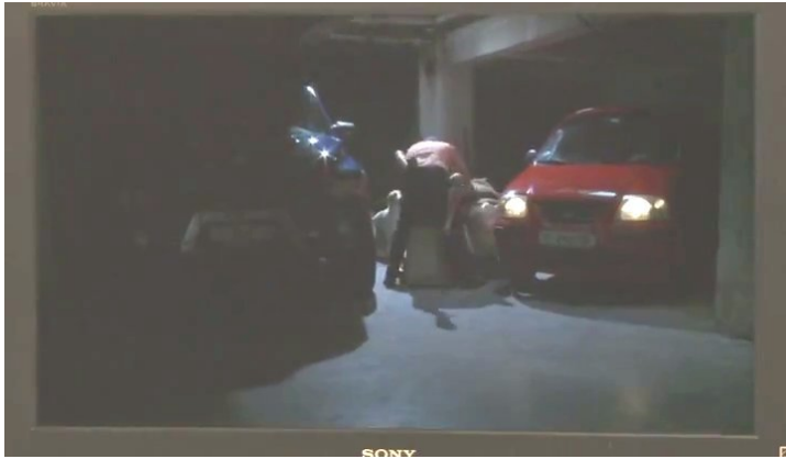
Fig. 5: La escena de violación de Ginette por el diplomático europeo

moral de tal afirmación, es posible constatar en el transcurso de la trama un movimiento asintótico entre Ana y Ginette: la inicial incomodidad y torpeza en su rol va cediendo a una identificación cada vez más fuerte de Ana con Ginette (sobre todo en la primera entrevista y luego en las filmaciones de Ginette para los europeos) hasta un proceso de identificación inverso: el de Ginette con Ana – que se va transformando en directora de la historia de su vida. 19 De esta forma la película no sólo pone en escena la relación de similitud entre ficción y realidad, sino que también desde una perspectiva de género implica un cambio de la posición de “objeto” a la de “sujeto”.