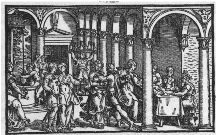
Fig. 6: Ludovico Ariosto, Decameron , Venezia: Gabriele Giolito de' Ferrari, 1546, cornice della prima giornata

ricorda con nostalgia lo stesso poeta nella IV satira, rivolgendosi al cugino Sigismondo Malaguzzi: