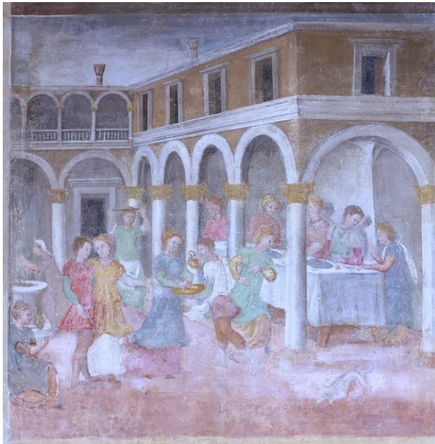
Fig. 5: Francesco Torbido detto il Moro, Decameron : cornice della prima giornata, Villa Pisani Bonetti, Bagnolo di Lonigo