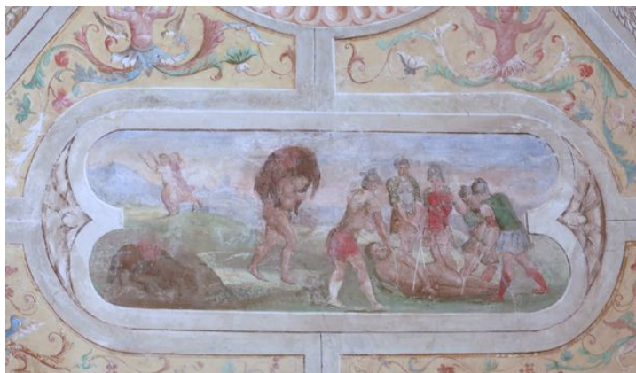
Fig. 3: Francesco Torbido detto il Moro, Astolfo restituisce il senno a Orlando , Villa Pisani Bonetti, Bagnolo di Lonigo

i casi dalle xilografie pubblicate da Gabriele Giolito de' Ferrari rispettivamente nel 1542 e nel 1546 17 (fig. 3, 4, 5, 6). Nel salone con volta a botte, il solo altro ambiente della villa decorato da affreschi, è raffigurato invece un carro di Fetonte di ispirazione ovidiana; anche in questo caso dunque fonti classiche e moderne sono affiancate e trattate con pari dignità. In particolare, la scelta del Decameron colpisce in quanto fino a questo momento, in quasi due secoli di diffusione del testo, solo due erano i cicli affrescati noti: le già citate Storie di Griselda a Roccabianca e quelle un tempo raffigurate nel Castello Visconteo di Pavia, a cui il ciclo emiliano era ispirato. 18