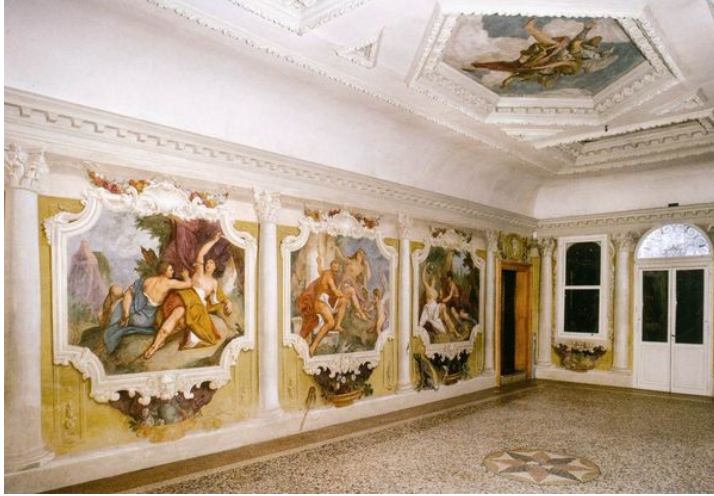
Fig. 7: Gregorio Lazzarini, Angelica e Medoro , Ercole e Onfale , Rinaldo e Armida , 1700–1710, Santa Bona di Treviso, Villa Zenobio

Gerusalemme liberata per la dimora veronese di Ercole Giusti, 38 o alle tele con Erminia fra i pastori , Rinaldo e Armida e Angelica e Medoro dipinte per palazzo Moro-Lin sul Canal Grande, collocate nella stessa sala con vari episodi di mitologia antica e di storia romana, o ancora all' Angelica e Medoro realizzato per il collezionista lucchese Stefano Conti. 39