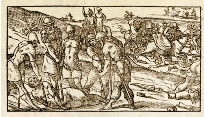
Fig. 4: Ludovico Ariosto, Orlando furioso , Venezia: Gabriele Giolito de' Ferrari, 1542, canto OF XXXIX, Astolfo restituisce il senno a Orlando