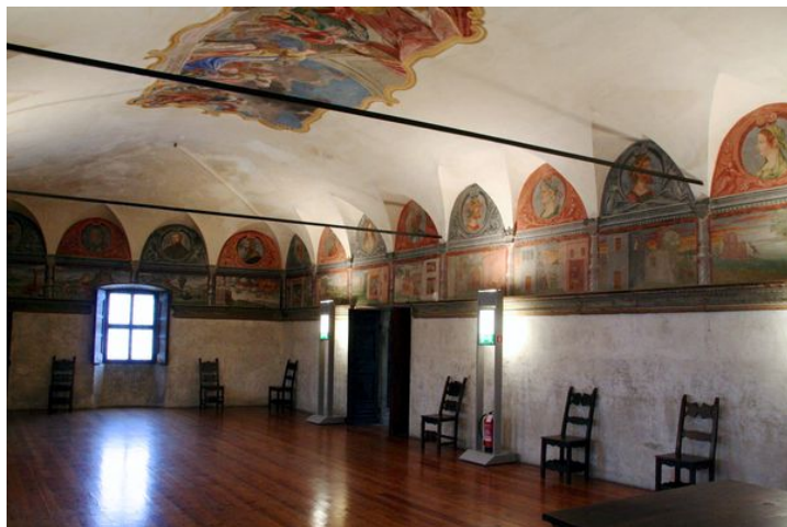
Fig. 2: Vincenzo e Michele de Barberis, fregio del salone d'onore, 1542–51, Teglio, Palazzo Besta, salone d'onore

che banale, e proprio per questo particolarmente significativo: appare evidente come il committente e il consulente iconografico attribuissero pari dignità ai due poemi e ritenessero efficace una rappresentazione parallela, eloquente nell'esprimere un comune messaggio di autocelebrazione dinastica e dimostrazione di aggiornamento culturale.