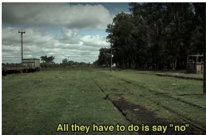
Fig. 5: DESOBEDIENCIA DEBIDA (01:33:45)

El final del documental plantea un enfoque contrafáctico de lo ocurrido (“qué hubiera pasado si ...”) y de lo que podría pasar, planteando un modelo histórico alternativo, cuyo ejemplo a imitar es, como ya indicamos, aquel accionar paterno de desobediencia a un rango superior.