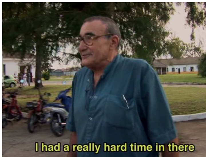
Fig. 3: DESOBEDIENCIA DEBIDA (00:08:13)

gunda escena, un sonido que se repetirá en escenas claves como, por ejemplo, cuando se enseña en detalle un centro clandestino de detención y tortura, se le sumará desde los primeros minutos del documental la voz de la directora, que, a través del relato de sus recuerdos e investigaciones, estructurará cada vez más la percepción del espectador.