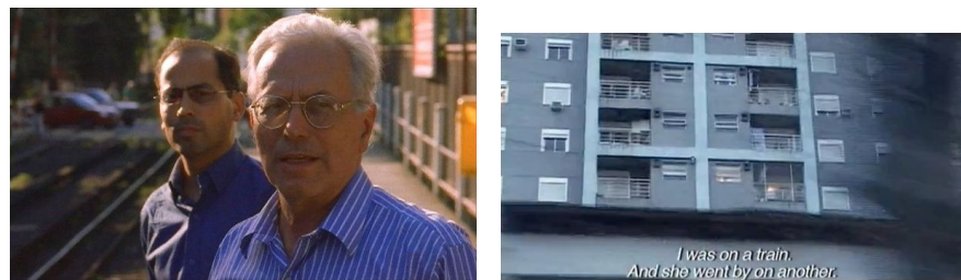
Fig. 1: LA TELEVISIÓN Y YO (2002) / FOTOGRAFÍAS (2007)

En esta dirección, si LA TELEVISIÓN Y YO narra el fin de una herencia con el quiebre de la empresa paterna, FOTOGRAFÍAS plantea, en contraste, la posibilidad de activar un legado posible de ser transmitido a su hijo Rocco. La figura de su padre, el famoso sociólogo Torcuato Di Tella (h), se conforma como un personaje ambiguo que, por un lado, posibilita el comienzo de la exploración de la historia materna al donar el archivo que da inicio a ese proceso y quien, por otro, simbólicamente es obstáculo en la recuperación de ese legado. Este aspecto se revela de varias maneras a lo largo de la película: en sus advertencias sobre la realización de un film sobre la familia, en su desapego a la tradición representado por la cremación de los restos o en la distancia con su propia experiencia en la India.