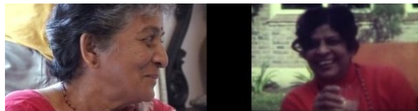
Fig. 3: FOTOGRAFÍAS (2007)

Finalmente, el recurso más recurrente y sobre el cual analizaremos el modelo de archivo en el siguiente apartado es la repetición y asociación de imágenes u objetos a lo largo de los diversos niveles de la filmación. Se trata, en la mayoría de los casos, de formas alegóricas o sumamente simbólicas dentro del documental. El caso más paradigmático es la figura del elefante, símbolo