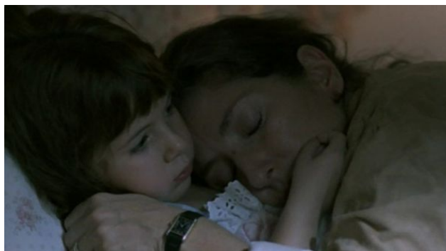
Fig. 1: Luis Puenzo, LA HISTORIA OFICIAL (1985)

En fin, para terminar, en la película que cierra la serie las escenas de la violencia y la muerte son sobre todo figuras del pensamiento y de la voluntad. La justicia revolucionaria y el terror son narrados a modo de una tragedia, un destino que se impone a los protagonistas. Las ideas y los conflictos que vienen del pasado se vuelcan sobre los sentidos de ese otro acontecimiento excepcional, la ejecución, el asesinato político que cierra la película y que deja abierta otra historia, terrible en sus consecuencias, que apela a la experiencia y la conciencia del espectador.