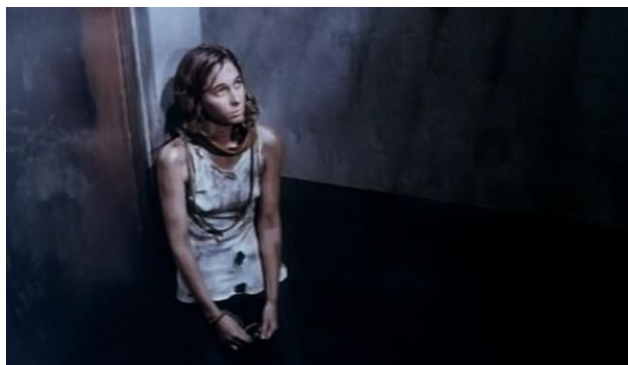
Fig. 2: Héctor Olivera, LA NOCHE DE LOS LÁPICES (1986)