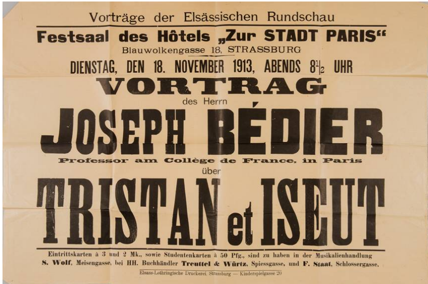
Fig. 2 : Conférence du 18 novembre 1913, à Strasbourg

pects de la personnalité de Bédier, qui est une certaine timidité, un manque d'aisance à l'oral qu'illustrent ses discours, comme ses cours ou autres interventions en public, tous intégralement rédigés. Il faut garder à l'esprit que Bédier est un véritable bretteur dans les débats, et on peut penser qu'il trouvait là le moyen de tirer ses arguments, et pour filer la métaphore, de porter l'estocade sans faiblir. En parallèle, certaines de ses conférences s'inscrivent dans un contexte particulier comme le montre une affiche annonçant l'une d'entre elles en Alsace, en 1913 (Fig. 2), à un moment où il insiste, notamment dans ses Légendes épiques , sur l'origine française et même franco-française des chansons de geste. C'est un moment où il achève de remettre en cause les théories allemandes élaborées par Friedrich August Wolf et plus tard les frères Grimm, ainsi que par Karl Lachmann, non pas évidemment pour des raisons strictement idéologiques mais également pour des raisons scientifiques, à une époque où la philologie allemande bénéficie encore d'une renommée et d'une autorité considérables hors de ses propres frontières. À noter d'ailleurs que c'est en cette même année 1913 que Bédier attaque de front le principe de la faute commune dans une édition du Lai de l'Ombre , et il continuera tout au long de sa carrière à remettre en cause ce principe