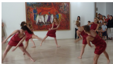
Fig. 4 : Au Musée national Marc Chagall sur le message biblique, à Nice, © I. Milliès, DRAC PACA

et la mettre en valeur, ou encore la mise en valeur des œuvres du 1 % artistique 11 présentes dans les établissements scolaires. Les projets mis en place cette année autour des commémorations de la grande guerre ont également donné lieu à diverses formes de projets pour lesquels l'appropriation de ce patrimoine par les jeunes n'est pas une mince affaire. Enfin, citons encore le mémorial du Camp des Milles , ouvert en 2012 à Aix-en-Provence, qui a introduit dans son parcours de visite des classes des ateliers qui accompagnent la partie « Réflexive » de la visite, en lien avec les programmes et le choix des enseignants.