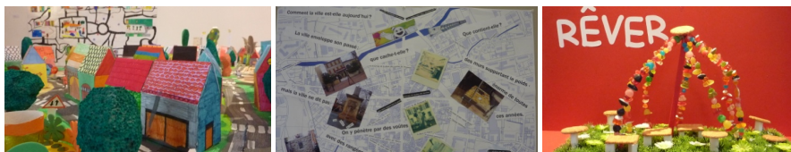
Fig. 3 : Le service d'animation du patrimoine du Pays d'art et d'Histoire de la Provence verte (Var) organise en partenariat avec la DRAC des résidences d'artistes pour développer l'appropriation de leur patrimoine par les jeunes du territoire.

La Charte introduit un mode de relation au patrimoine, l'« adoption », mieux adapté aux caractéristiques de la société française que l'« héritage ». La structuration de l'identité culturelle des individus passe moins par la compréhension d'un héritage culturel dans lequel ne peut se reconnaître une grande partie de la population, que par un processus d'adoption d'un patrimoine constitué des créations successives des hommes et des sociétés qui nous ont précédés sur le territoire où nous vivons aujourd'hui, sans être tous, loin s'en faut, nos ancêtres. L'identité culturelle des individus se nourrit des rencontres avec des cultures différentes, des adoptions successives qui peuvent jaloner l'histoire de chacun. « Adopter son patrimoine » c'est donc aussi rendre possible l'ouverture au patrimoine des autres, non pas pour se l'approprier, ou l'enfermer dans un regard exotique, mais pour engager un dialogue reconnaissant l'égalité des cultures, [...]. L'adoption du patrimoine de l'autre dans un mouvement de reconnaissance réciproque, permet de lui donner une dimension universelle, sans pour autant que cette universalité se paie d'une uniformisation des cultures. » 10