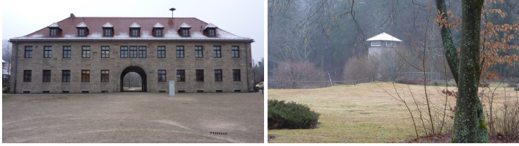
Fig. 5 : Mémorial Camp de Flossenbürg, Allemagne

de médiateur et les amène à effectuer tout le processus d'appropriation préalable à la démarche de création : recherche sur le sens et le contexte de création d'une œuvre ou d'un objet remarquable, analyse des codes et des langages esthétiques utilisés pour sa création, interrogation sur la place et la fonction contemporaine de l'œuvre ou de l'objet remarquable, sur son rapport intime et personnel à cet objet, et enfin initiation à un langage artistique dans lequel exprimer ce que l'on a à dire sur ce patrimoine. En lui donnant la parole, l'expérience de création artistique apporte au jeune public l'opportunité de s'approprier ce patrimoine et le libère d'un héritage subi et éloigné de ses préoccupations contemporaines.