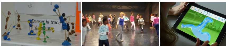
Fig. 2 : Des projets d'éducation à la danse avec des artistes trouvent un prolongement en classe avec les enseignants dans le cadre de leur programme scolaire