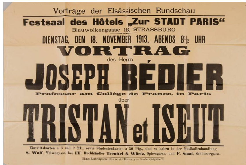
Fig. 2 : Conférence du 18 novembre 1913, à Strasbourg

pects de la personnalité de Bédier, qui est une certaine timidité, un manque d'aisance à l'oral qu'illustrent ses discours, comme ses cours ou autres interventions en public, tous intégralement rédigés. Il faut garder à l'esprit que Bédier est un véritable bretteur dans les débats, et on peut penser qu'il trouvait là le moyen de tirer ses arguments, et pour filer la métaphore, de porter l'estocade sans faiblir. En parallèle, certaines de ses conférences s'inscrivent dans un contexte particulier comme le montre une affiche annonçant l'une d'entre elles en Alsace, en 1913 (Fig. 2), à un moment où il insiste, notamment dans ses Légendes épiques , sur l'origine française et même franco-française des chansons de geste. C'est un moment où il achève de remettre en cause les théories allemandes élaborées par Friedrich August Wolf et plus tard les frères Grimm, ainsi que par Karl Lachmann, non pas évidemment pour des raisons strictement idéologiques mais également pour des raisons scientifiques, à une époque où la philologie allemande bénéficie encore d'une renommée et d'une autorité considérables hors de ses propres frontières. À noter d'ailleurs que c'est en cette même année 1913 que Bédier attaque de front le principe de la faute commune dans une édition du Lai de l'Ombre , et il continuera tout au long de sa carrière à remettre en cause ce principe