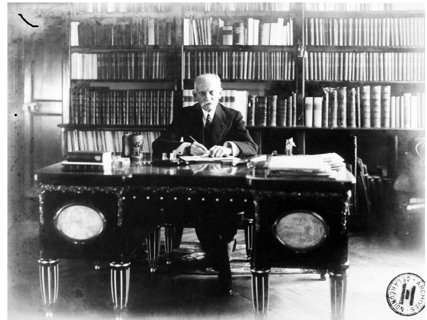
Fig. 1 : Joseph Bédier à son bureau de la Réunion. Archives départementales de la Réunion, 2Fi47/169. Photographie de G. L. Manuel Frères. Tous droits réservés