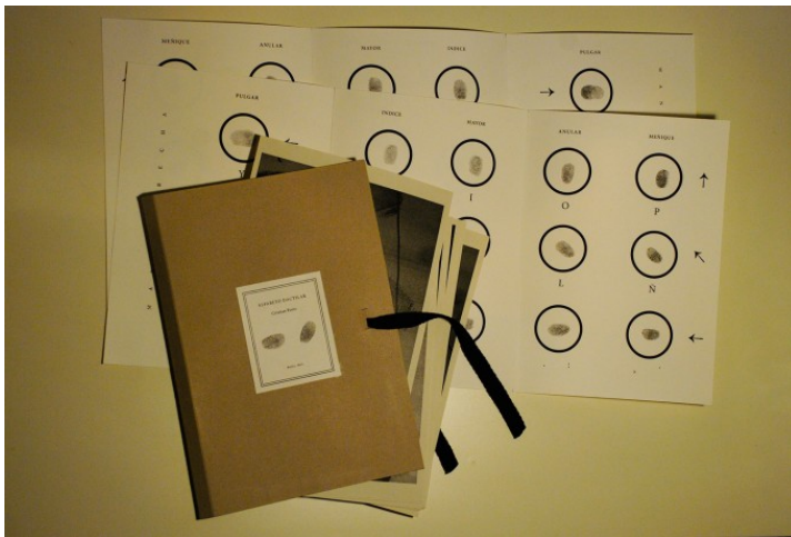
Fig. 2: Cristian Forte, Alfabeto Dactilar (2014)

Bajo la perspectiva de una impregnación surrealista del colectivo artístico Etcétera ... y de los trabajos de Cristian Forte, queremos, en este punto, tender un puente delgado hacia el surrealismo argentino de las vanguardias históricas recurriendo a la visión de Aldo Pellegrini sobre la figura del* de la poeta. El surrealista argentino Aldo Pellegrini (1903–1973), quien fundó, solamente dos años después de la publicación del primer Manifiesto Surrealista por