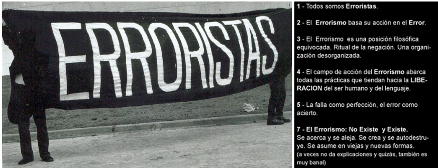
Fig. 1: “Etcétera ... presenta a la Internacional Errorista”, Página/12, Etcétera ... Etcétera ... , suplemento de la exposición, 5.