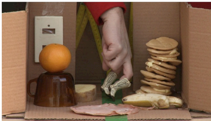
Fig. 6: El teatro “new burlesque” de Víctor

cock. Como se sabe, en esta metapelícula sobre el espectáculo y voyeurismo, abundan las alusiones sexuales (por ser los departamentos de enfrente del de James Stewart y Grace Kelly variaciones irónicas o trágicas sobre el tema de la sexualidad y del matrimonio 11 ), y observamos que REAR WINDOW se estrenó en 1954, un año después de la casa Curutchet de Le Corbusier.