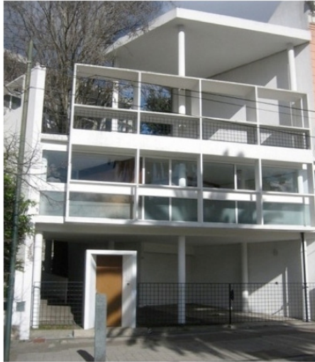
Fig. 1: Casa Curutchet (1948–53), La Plata