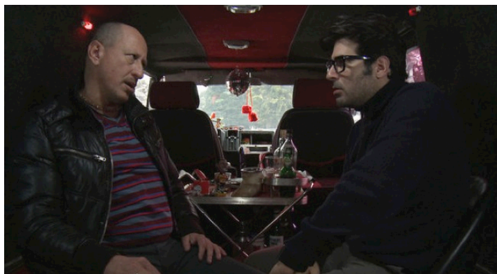
Fig. 7: Una relación ambigua entre los dos hombres

erótico sobre Leonardo, que se debate entre su deseo de parecerse –aunque solo fuera por un instante– a ese hombre que solo vive al compás de sus pulsiones, y las reglas que le impone su propia vida social y conyugal. 12