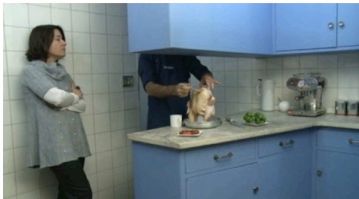
Fig. 5: El pollo decapitado

ocasiones en la cama con su esposa, nunca tiene relaciones sexuales con ella (es decir que conoce un estado de aphanisis o pérdida de la sexualidad). De hecho, se nota la creciente incomunicación que impera en su relación matrimonial, la frustración sexual (se queja en algún momento de “no coger desde hace meses”) y el papel de dominado que desempeña en sus relaciones con las dos mujeres de su casa (tanto con su esposa, a la que miente constantemente, como lo haría un niño con su mamá; como con su hija, con la que nunca logra establecer un diálogo, y que siempre tiene sus audífonos puestos para evitar cualquier contacto con él).