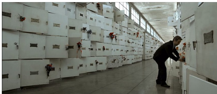
Fig. 2: Fotograma 2

Si bien la película articula desde la perspectiva crítica de las alegorías nacionales un estado desolador de la colectividad, no construye un héroe positivo que se vincule o se comprometa con el devenir social. Los sujetos quedan en EL SECRETO DE SUS OJOS redefinidos en sus propios universos singulares (Benjamín reconectado libidinalmente con la existencia, Morales fijado en su castigo privado y preso en su carcel de melancolía). Los dos personajes son tal vez muestras de las subjetividades que produce la sociedad retratada en la película.