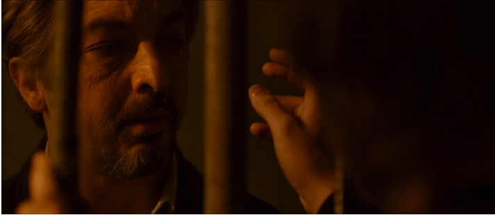
Fig. 1: Fotograma 1

La mirada de Benjamín en silencio, su gesto de retroceder cuando el asesino quiere tocarlo a través de los barrotes (1), aunque subrayan su espanto ante la escena que está presenciando, indican también su indiferencia ante la súplica del asesino.