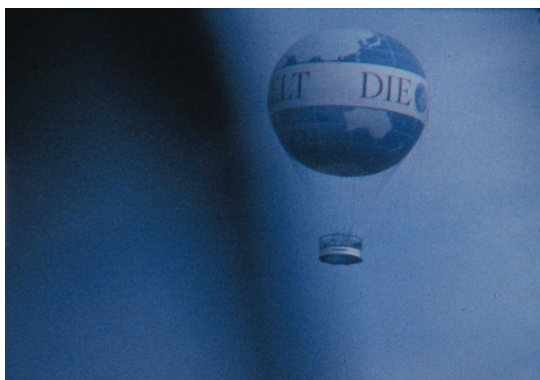
Fig. 8: DENKBILDER de Pablo Marín