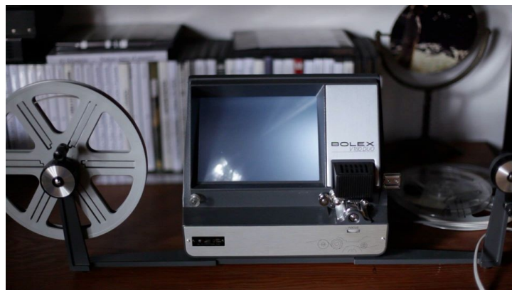
Fig. 5: REFLEJO NARCISA de Silvina Sperling