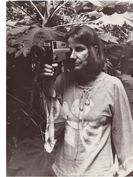
Fig. 4: NARCISA de Daniela Muttis.

El resultado es un documental que no sólo se concentra en la intimidad de Narcisa Hirsch sino que se constituye como el documento registro de una época, los finales de los años 60.