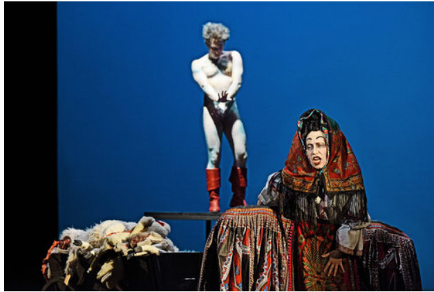
Abb. 2: Inszenierungsfoto Perelà. Uomo di fumo

gen; V–X 12 : Erkundungen Perelàs; XI–XVI 13 : Tod Alloros, Prozess und Haft, Flucht. Der Text reiht Dialoge und Monologe so aneinander, dass die Erzählperspektive oft unklar bleibt, Groteskes und Komisches wird mit Ernstem vermischt, es wird mit Klängen und Worten gespielt, Bilder des Surrealen und der Technik evozieren die futuristischen Ästhetiken. 14