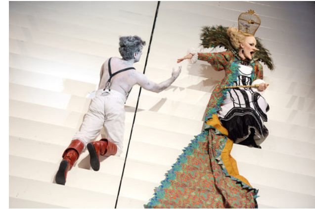
Abb. 3: Inszenierungsfoto Perelà. Uomo di fumo

Dusapin ist, ähnlich wie Palazzeschi es war, als zeitgenössischer Komponist unabhängig von ästhetischen Dogmen. Sein Orchester ist klassisch aufgebaut, und Expressivität ist für ihn kein Tabu. 26 So stattet er die Figuren mit eigenen musikalischen Chiffren aus, die ihre jeweilige Gefühlslage zeigen. Die reiche Instrumentierung besticht auch durch ihren Variantenreichtum: viel Schlagwerk und die Instrumentengruppen isoliert einsetzend erreicht Dusapin eine suggestive Einheit mit dem in Text und Szene vermittelten Inhalt und erzählt doch mit der Musik eine zweite Geschichte. Er sagt