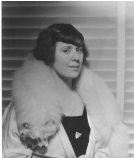
Abb. 2: Hilla Rebay, 30er Jahre

In diesem Chor der Stimmen gibt es auch dominante Solostimmen wie die ihrer Künstlerfreundin Hilla (von) Rebay, 11 die oft vorbeikommt, manchmal in Begleitung von Solomon R. Guggenheim, den sie bei Ankäufen europäischer Kunst berät. Zuweilen steht sie selbst kurz vor dem Aufbruch nach Deutschland oder Nordamerika und berichtet den Delaunays von Verfolgung, Gewalt und Angst im NS-Deutschland.