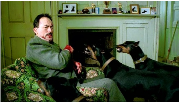
Abb. 2: Filmstill aus THE BOYS FROM BRAZIL, dir. Franklin J. Schaffner, 1978.

Mengele als literarische Figur findet sich früh, etwa in Friedrich Dürrenmatts Der Verdacht verklusult als Gegner des Juden Gulliver, der im Konzentrationslager Stutthoff Opfer des Arztes Nehle war. Der Film WAKOLDA, der auf dem gleichnamigen Roman der Argentinierin Lucía Puenzo beruht, zeigt Mengele grotesk an Arier-Puppen bastelnd. 29 Erzählökonomisch am