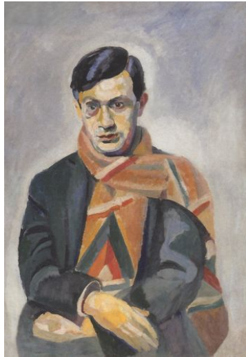
Abb. 1: Robert Delaunay: Porträt Tristan Tzara (1923)