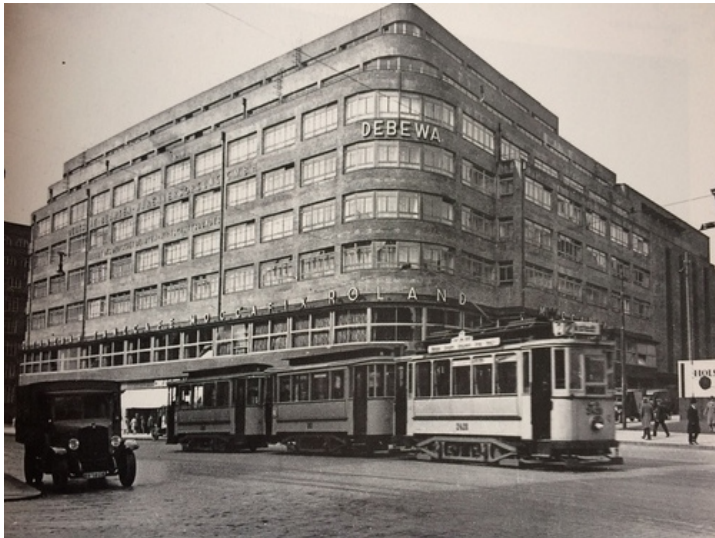
Abb. 7: Das Deutschlandhaus am Hamburger Gänsemarkt (um 1930)

gegangen, „ein[em] moderne[n] Geschäftshaus mit Büros, Läden, Restaurants und dem damals größten Kinosaal Europas, dem Ufa-Palast“ 21 .