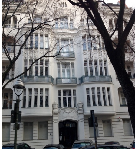
Abb. 9: Emmy Roths Werkstatt (und vermutlich Wohnhaus) in der Clausewitzstraße (2016)

Berlin-Charlottenburg, in der noblen Clausewitzstraße 8, wo sie vermutlich auch wohnt und in deren Umfeld sie einen angemessenen Wirkungsort findet.