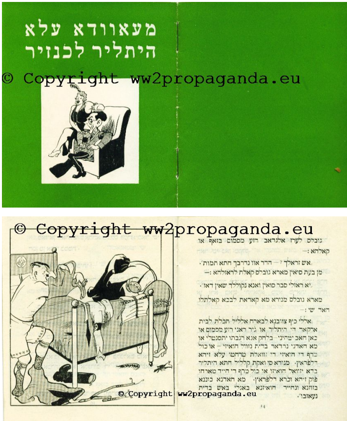
Abb. 1: Auszüge aus dem Anti-NS-Pamphlet hitlir l-x nsir (Marokko ca. 1942)

Phonographische Umschrift von S. 14, Z. 1 – 5 (mit Umkehr der Schreibrichtung re – li; nur das Aliph א, das nicht nur phonographisch für /a/ genutzt wird, wird beibehalten); darunter Entsprechung im mar. Arab. (Schreibfehler, Worttrennungen u. dgl. korrigiert; judenarabische Besonderheiten normalisiert, z. B. z > 3); darunter wortweise Wiedergabe im Deutschen