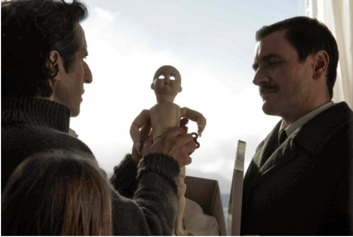
Abb. 1: Filmstill aus WAKOLDA = THE GERMAN DOCTOR, dir. Lucía Puenzo, 2013.