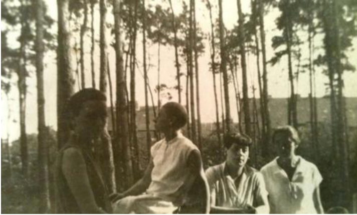
Abb. 3: Florence Henri (3. von links) 1927 am Dessauer Bauhaus

denen sie während der gesamten Zeit ihres zehnjährigen Exils in Paris befreundet bleiben, berichtet Kandinsky in einem Brief an Will Grohmann: