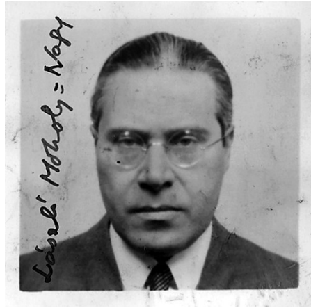
Abb. 4: Unbekannter Fotograf: Laszlo Moholy-Nagy um 1938